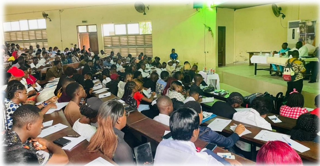
Causerie éducative autour du thème « Jeunesse : impératif de la paix, facteur de la stabilité sociale et économique » le 06 Février 2023 à l'Université de Douala.