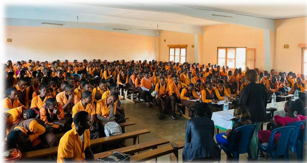
Sensibilisation sur la consommation de la drogue en milieux scolaires en Février 2023 au lycée de Babouanto