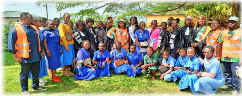
Campagne de sensibilisation sur les droits de la femme et de la jeune fille à Bafang place de l'Indépendance en Déc 2023