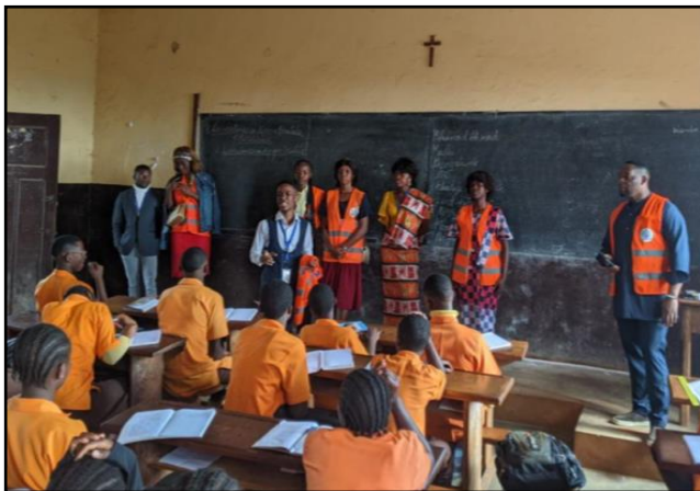
Campagne de sensibilisation et de formation aux droits de l’homme au collège bilingue ST PAUL DE BAFANG le 06 Mai 2023

Cette activité a également consisté à mettre sur pied des « cases de droits » et des causeries éducatives pour informer les communautés sur les dispositions juridiques nationales et internationales sur les droits de l’homme et surtout pour une assistance juridique et judiciaire de qualité appréciable ;