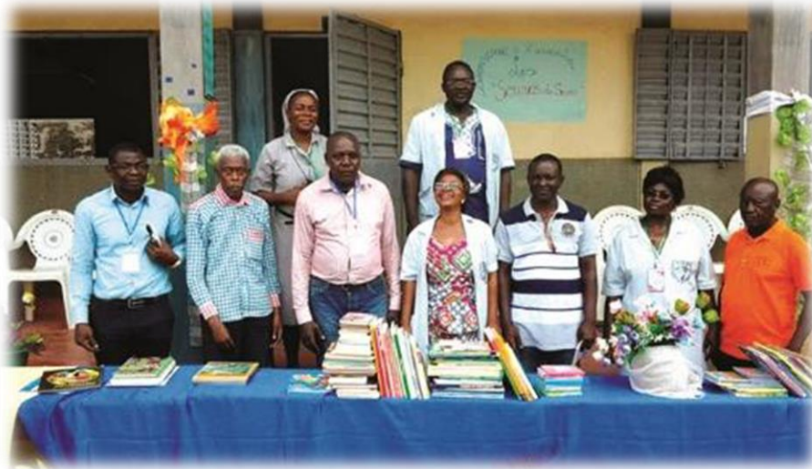
Remise de prix aux meilleurs élèves du Lycée de du village Fondjomekwet, village basé à l'Ouest Cameroun et précisément dans le département du Haut-Nkam, arrondissement de BANDJA