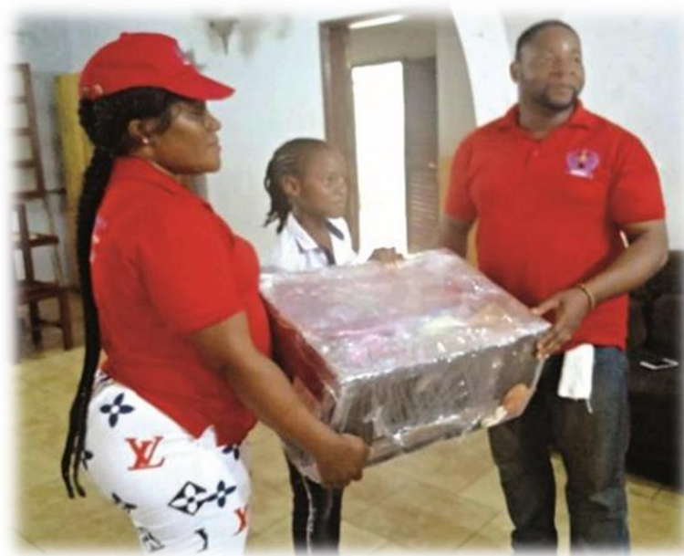
Don à l'orphelinat main dans la main à Bonamoussadi le 23 Décembre 2023

Pour assurer la bonne éducation de la jeunesse camerounaise comme à son habitude, les BAHUJ ont distribué à l'occasion de la rentrée scolaire 2023-2024 des manuels scolaires dans plusieurs orphelinats. Conscients de ce que ces enfants qui n'ont plus de parents ont moins de chance de se scolariser, les membres de l'organisation ont décidé de soutenir quelques orphelinats de la ville de Douala. Notamment « l'orphelinat Rhemar Cameroun » situé à Logpom, « l'orphelinat Les Amis de Jésus » situé à Bonamoussadi. Deux (02) mois après la rentrée scolaire, les membres des BAHUJ sont descendus dans ces deux orphelinats les mains chargées. On pouvait découvrir dans de nombreux cartons transportés ici, le matériel didactique d'une part, tels : des boîtes de craie, des crayons de couleurs, des cahiers, des livres, des marqueurs ; d'autre part, quelques denrées de premières nécessités pour permettre aux gestionnaires des différents orphelinats de gérer, le petit déjeuner des pensionnaires. Dans l'ensemble c'est près de deux cent (200) enfants qui ont eu droit aux fournitures scolaires dans les deux orphelinats visités.