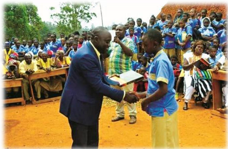
Remise des prix aux meilleurs élèves du Lycée de BATSENGLA par DSCHANNG en Juillet 2023

Un appui en matériel didactique a pareillement été fait aux différentes écoles et collèges du village. Une bourse scolaire pour les uns qui leur a permis de débiter l'année scolaire en beauté. Ce coup de main n'a pas laissé les parents et enseignants indifférents. Ceux-ci ont invité les responsables de l'organisation à multiplier l'initiative et à l'étendre à l'échelle environnementale et même régionale. C'est plus de deux cents (200) élèves qui ont bénéficié de cette action-là.