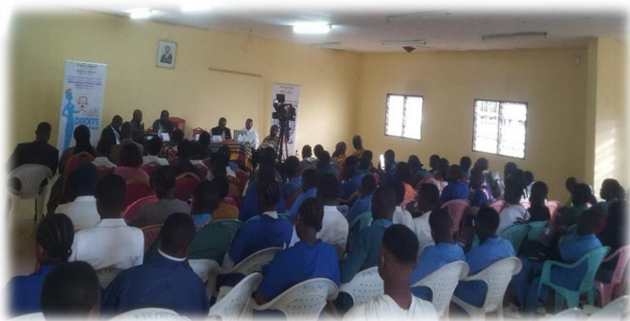
Conférence sur le thème : « les modes non violents de règlement de conflit en milieux scolaires au CPFF de Bafang le 02 oct. 2023 à l'occasion de la célébration de la journée internationale de la non-violence

L'association LES BAHUJ a milité aux cotés de la communauté nationale et internationale pour sensibiliser les jeunes en milieux scolaires et universitaires sur la pratique de la non-violence et par ricochet de la gestion des litiges à l'amiable. Le CPFF de Bafang a abrité une de ces séminaires.