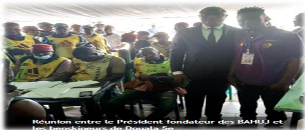
Réunion entre le Président fondateur des BAHUJ et les benskieneurs de Douala 5e

principales missions. Et pour donner de la valeur à ce corps de métier désormais reconnu, à côté de bien le pratiquer, il fallait l'organiser. D'où l'importance du recensement ; du regroupement par secteur ou par zone et surtout le respect des mesures mises sur pieds par le gouvernement de la république pour exercer cette profession. Un appel à la formation en conduite a été fait, de même que la nécessité de s'assurer. Il fallait aussi inviter ces derniers à pouvoir s'identifier avec les chasubles et autres. L'invitation à être polis et courtois durant le service a été souhaitée. Les B.A.H.U.J ont organisé au moins trois sessions d'échange avec les membres du SYNAMOTAC. L'objectif visé par ces échanges était, d'éviter la grogne sociale que ce corps de métier crée souvent dans la Capitale économique du Cameroun. Estimés à plus de 400 000 dans la seule capitale économique du Cameroun. Conducteurs de moto s'ils ne sont pas encadrés peuvent être des dangers sociaux