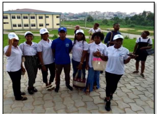
Clinique juridique faite en faveur des élèves et étudiants dans la ville Douala le 12 mai 2023 au campus Universitaire de Douala

Proces fictif à l’université d Douala dans le but de renforcer les capacités juridiques et judiciaires des apprenants