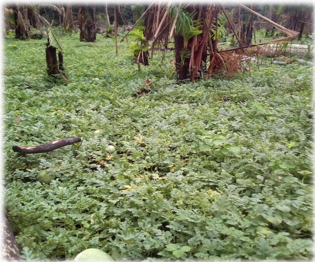
Projet d'Agriculture amorcé dans les sites de Mbandjock par les BAHUJ