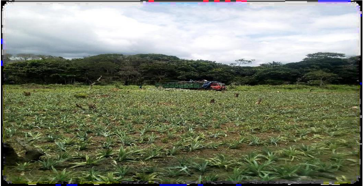
Projet d'Agriculture amorcé dans les sites de Koeteng par les BAHUJ