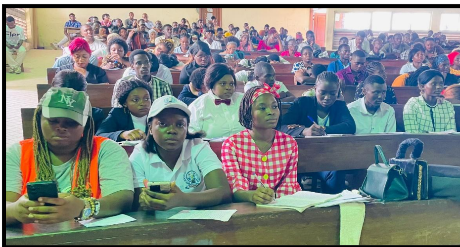
Séminaire du 05 Février 2023 à l'hôtel Y portant sur le thème « Traitement moral des jeunes »

Ces activités sont organisées soit dans les écoles et universités dans le but d'éduquer le citoyen lambda sur les notions de base qu'est le droit de l'homme, la liberté dans toutes ses formes